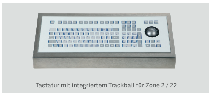
Tastatur mit integriertem Trackball für Zone 2 / 22