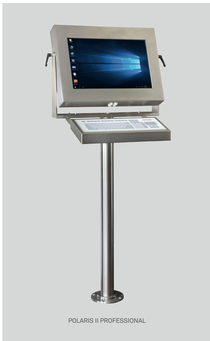
POLARIS II PROFESSIONAL